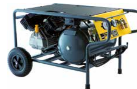
Schneider CPM L 330-10-20 WX