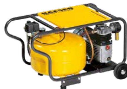
Kaeser Premium Car